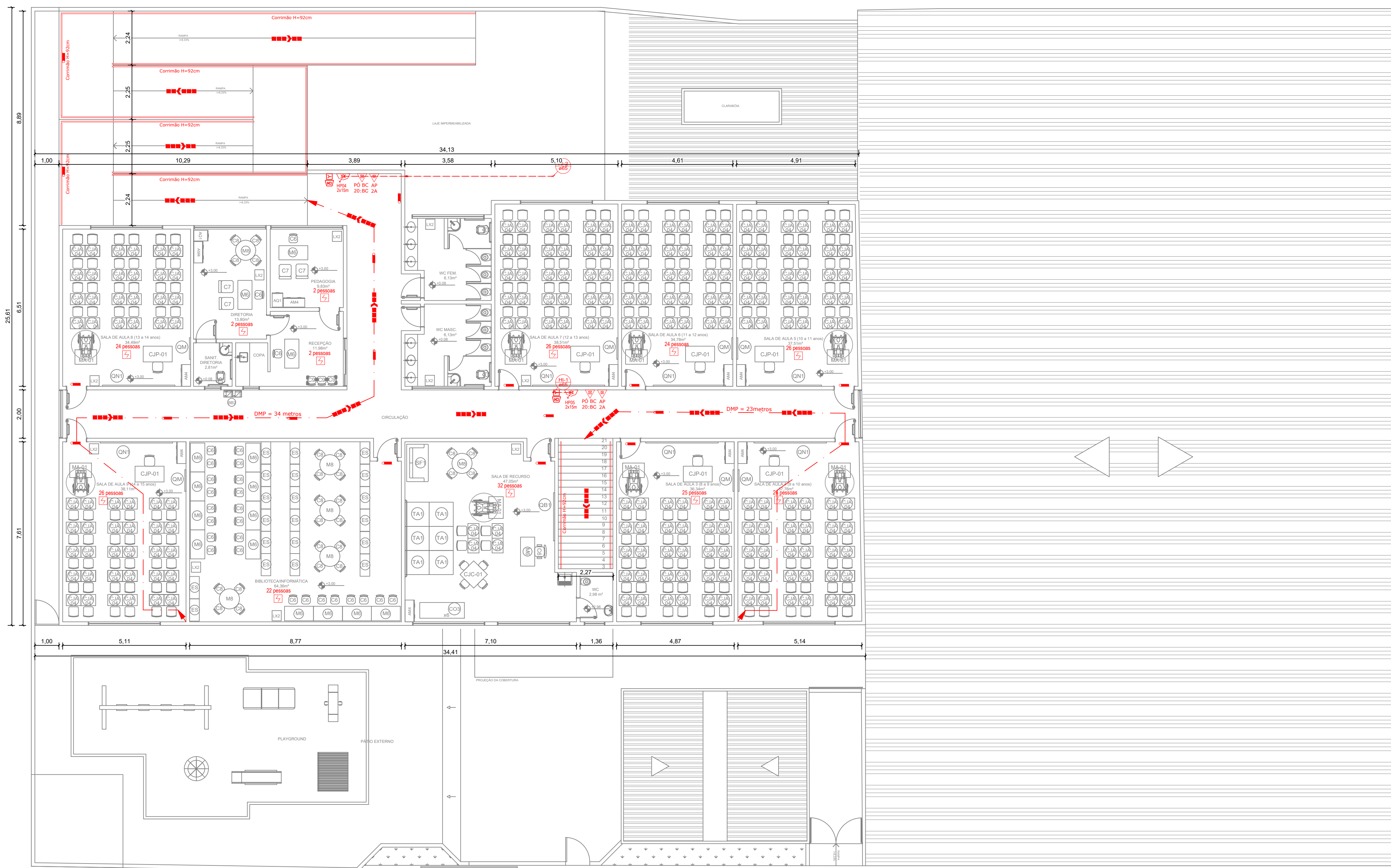
PLANTA BAIXA - 1º PAVIMENTO Escala: 1/100 POPULAÇÃO DO PAV. - 638 pessoas